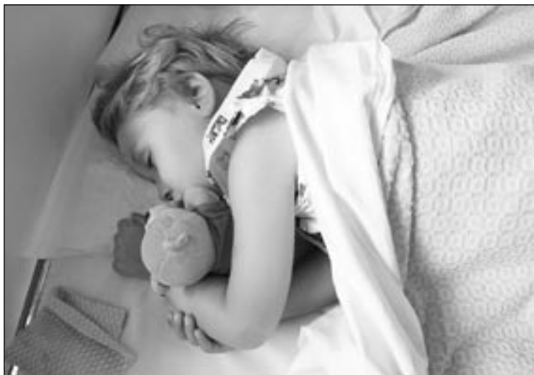
Ook Bram is nog in dromenland.